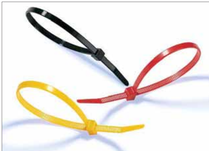
Buntebåndene i T-serien er perfekte til bunting og sikring av kabler og ledninger. Benyttes til mange forskjellige formål og leveres i en rekke forskjellige farger og materialer.

For bunting og sikring av for eksempel kabler, ledninger, rør og slanger.